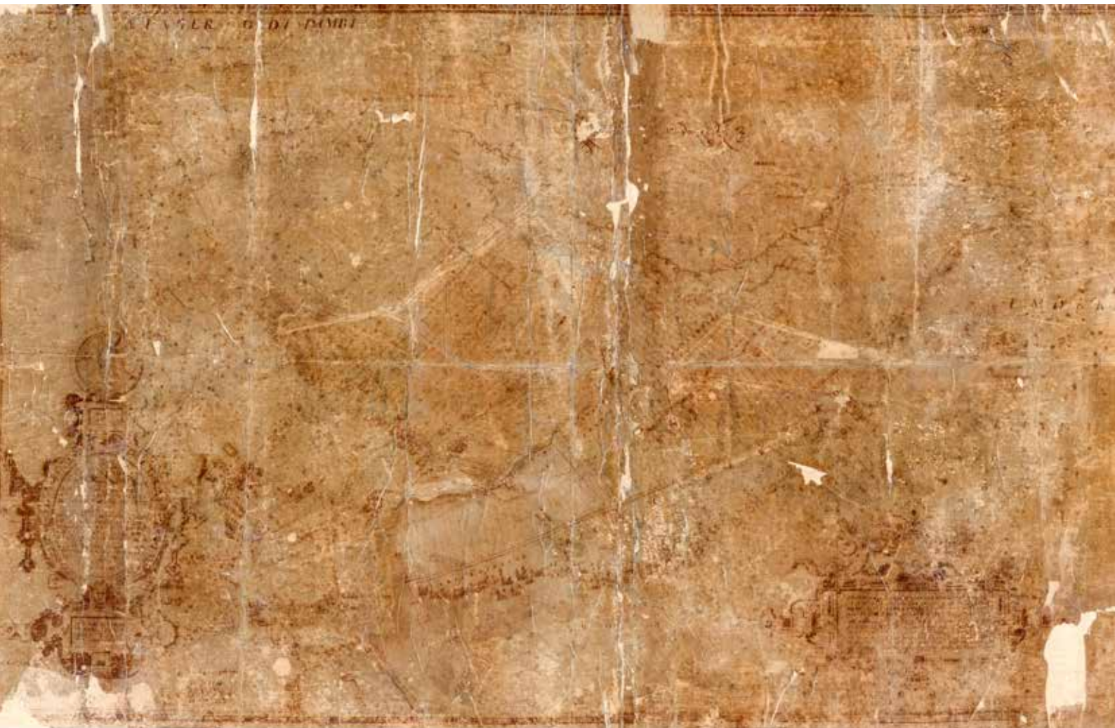
De originele, op karton geplakte, door plakplastic beschadigde en nagenoeg onleesbare kaart van Brunij uit 1590.