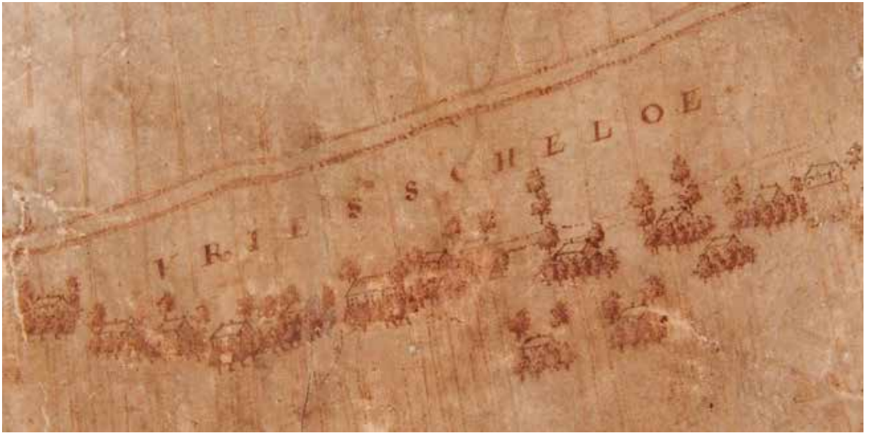
Detail uit de kaart van 1590 van het kerspel Vriescheloo, met onder de eerste 's' van de dorpsnaam de kerk.